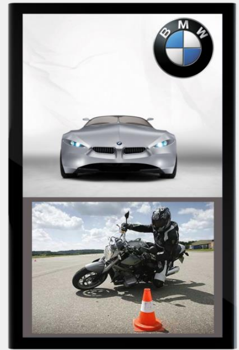
Werbung und Produktpräsentation